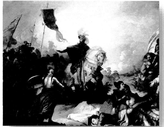
La bataille de Marignan (1515)

Il s'intéressa aussi à l'Amérique , que les Européens venaient de découvrir, et encouragea les explorations , dont celles de Jacques Cartier au Canada .