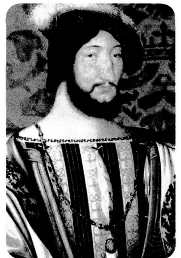
François 1 er (1 er )

Contrairement à d'autres rois avant lui, il décida seul de l'augmentation des impôts .